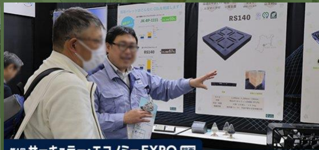
第1回 サークュラー・エコノミー EXPO 関西 CE JAPAN