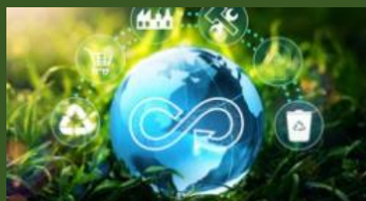
サーキュラー・エコノミーEXPO